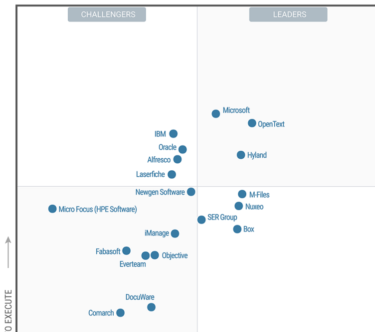
Figure 1. Magic Quadrant for Content Services Platforms

Que vous soyez un utilisateur métier ou un professionnel de l'informatique, nous sommes convaincus que notre plateforme est une solution idéale pour votre organisation.